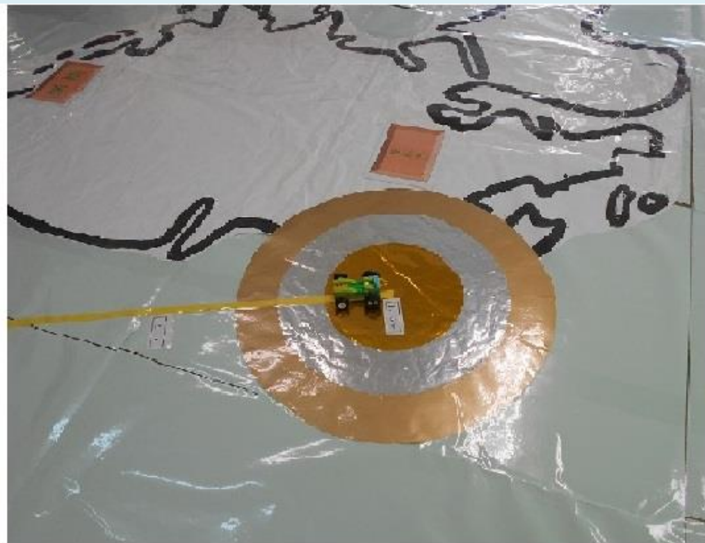
【理科研究会 授業風景その1】

シートの持つ静電気ので、床に貼り付き、さらに印刷物の上から透明タイフを貼り付けることが出来る特性が生かされ、「ゴムや風の力の働き」授業に活用されました。