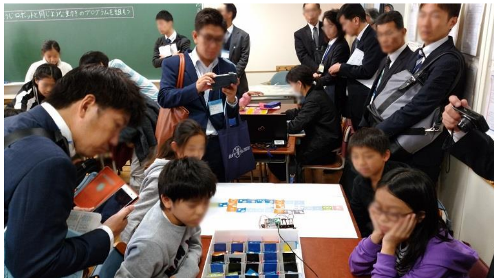
理科研究会 授業風景その2

シートの持つ静電気ので、テスクに貼り付き、書き消しできる特性が活かされ、6年生理科“電気を制御する（プログラミング）”授業に活用されました。