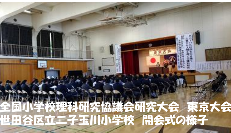
全国小学校理科研究協議会研究大会 東京大会 世田谷区立二子玉川小学校 開会式の様子

シートの持つ静電気ので、テスクに貼り付き、書き消しできる特性が活かされ、6年生理科“電気を制御する（プログラミング）”授業に活用されました。