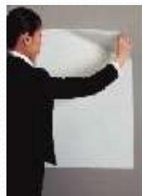
利用静电引力贴付于墙壁上