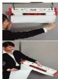
有打孔可以撕下一张