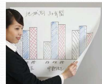
一卷内共有 25 张这样的薄膜