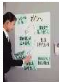
可以像使用白板一样，在上面反复书写，擦掉修改，